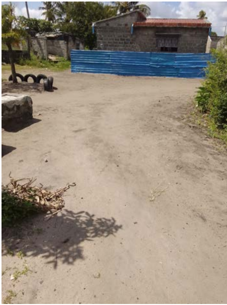
Foto do espaço livre para construção/armazém/preparação da obra