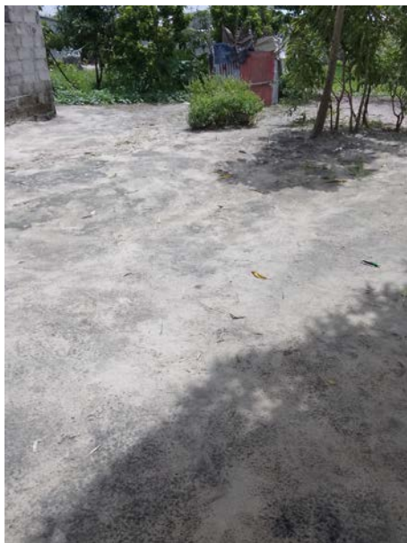
Foto do lugar onde o AF pode ficar temporariamente

Clique aqui para fazer o upload do arquivo. (<100MB)