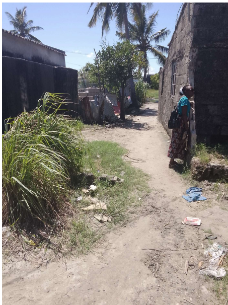
Foto do espaço livre para construção/armazém/preparação da obra