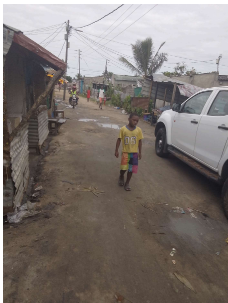
Foto do espaço livre para construção/armazém/preparação da obra