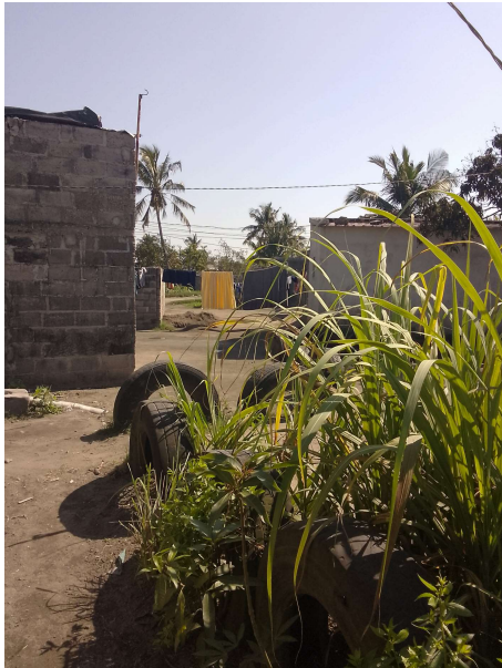
Foto do espaço livre para construção/armazém/preparação da obra