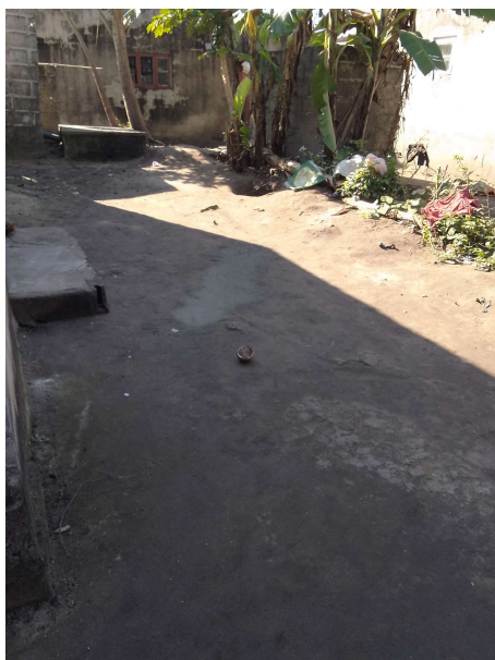
Foto do lugar onde o AF pode ficar temporariamente