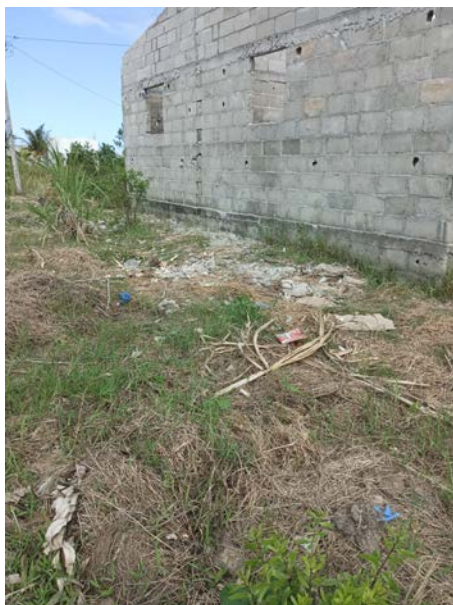
Foto do lugar onde o AF pode ficar temporariamente

Clique aqui para fazer o upload do arquivo. (<100MB)