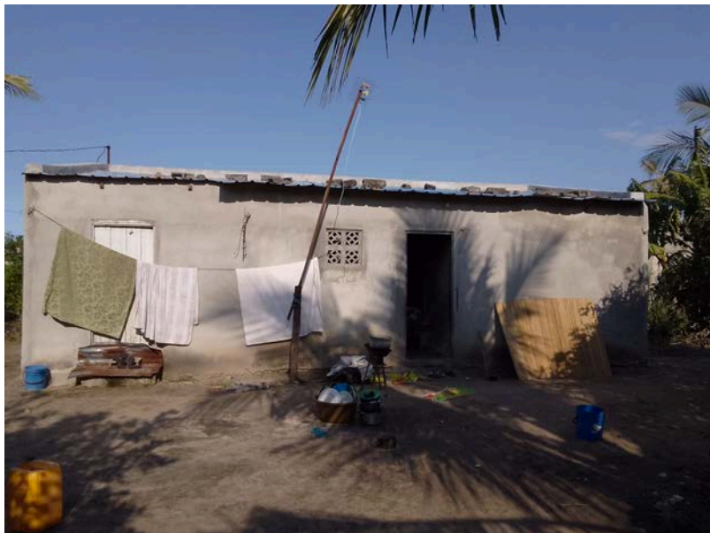
Habitação - Foto da esquina 2