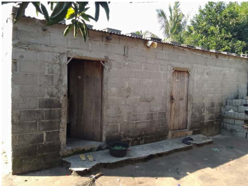
Habitação - Foto da esquina 2