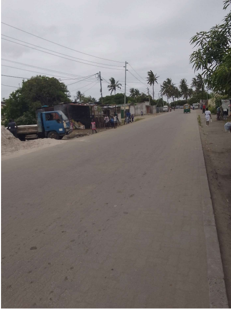
Foto do espaço livre para construção/armazém/preparação da obra