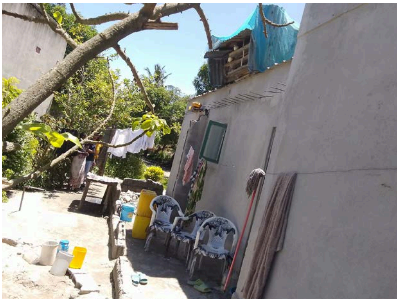
Foto da casa