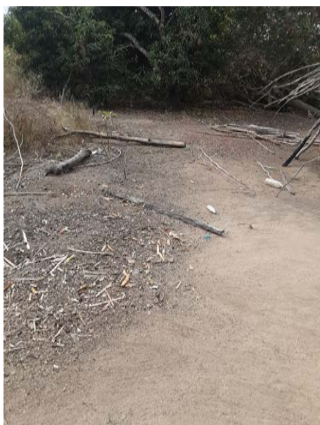
Foto do lugar onde o AF pode ficar temporariamente