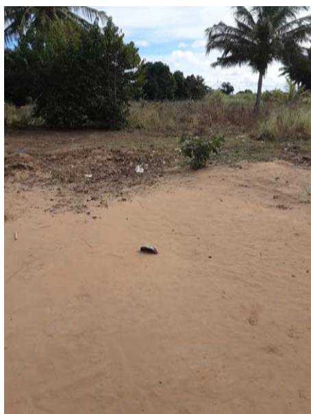
Foto do lugar onde o AF pode ficar temporariamente