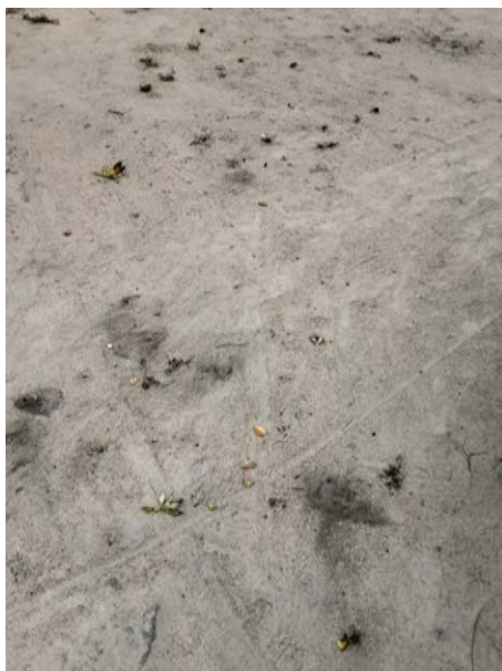
Foto do lugar onde o AF pode ficar temporariamente