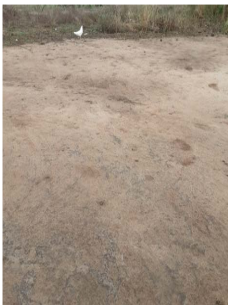
Foto do lugar onde o AF pode ficar temporariamente