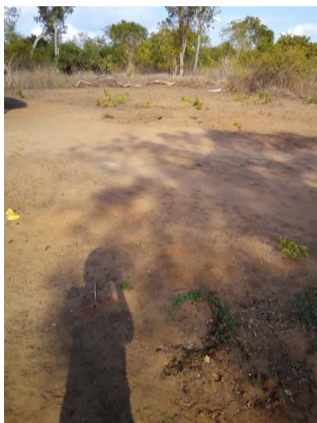
Foto do lugar onde o AF pode ficar temporariamente