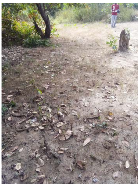
Foto do lugar onde o AF pode ficar temporariamente