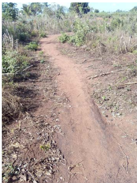
Foto do espaço livre para construção/armazém/preparação da obra