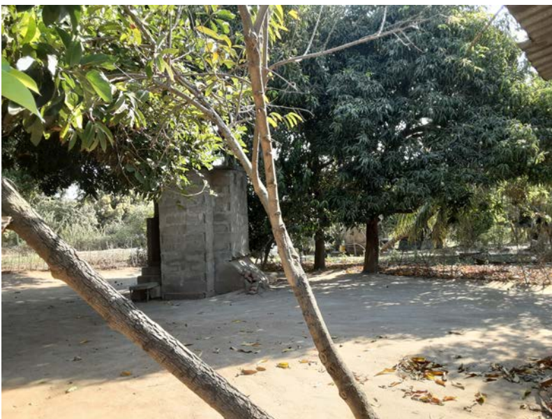
Foto da casa