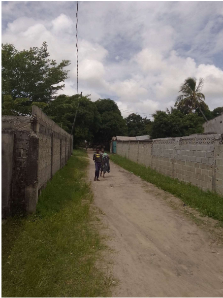
Foto do espaço livre para construção/armazém/preparação da obra