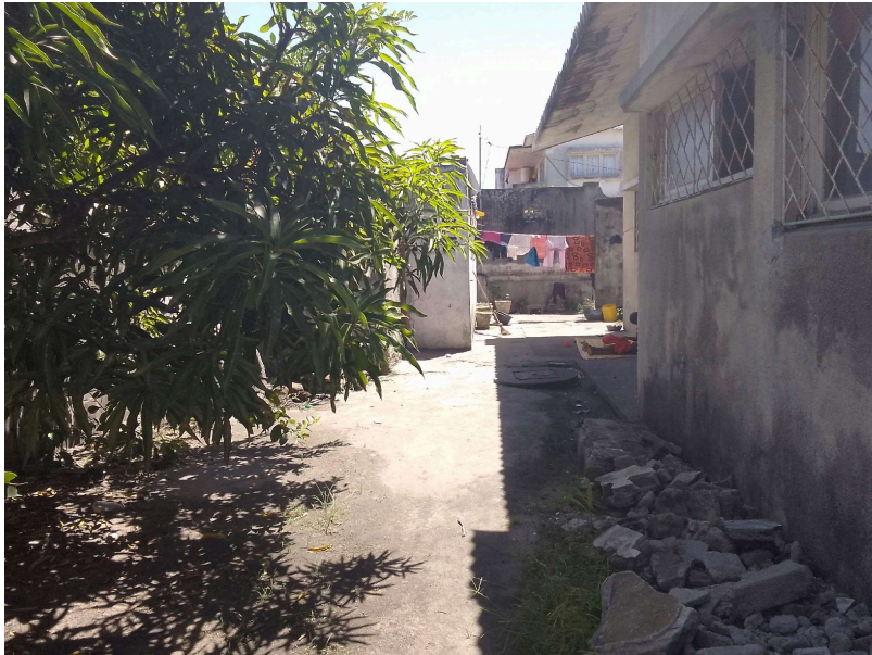
Foto da casa