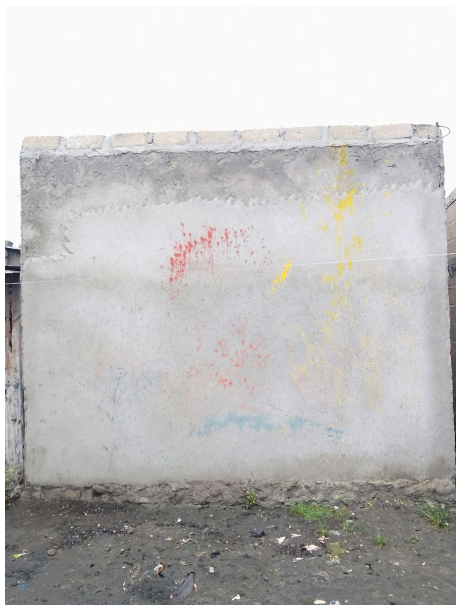
Foto da casa