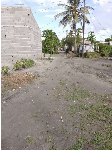
Foto do espaço livre para construção/armazém/preparação da obra