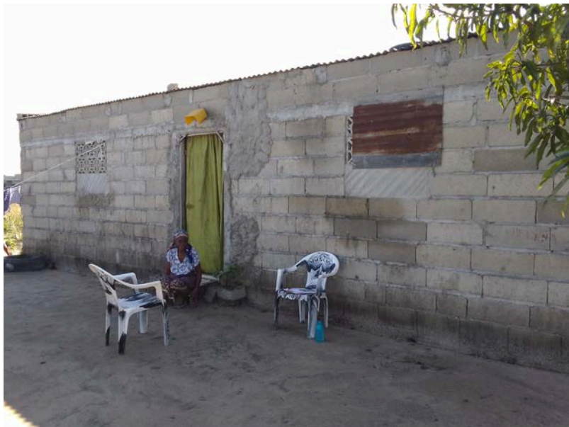
Habitação - Foto da esquina 2