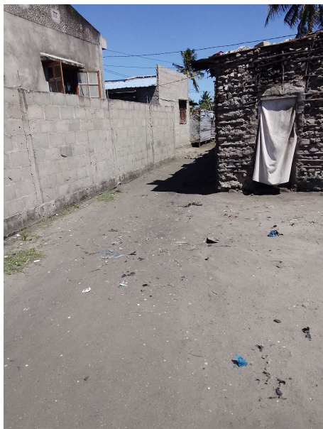
Foto do espaço livre para construção/armazém/preparação da obra