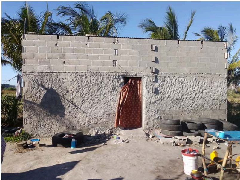
Habitação - Foto da esquina 2