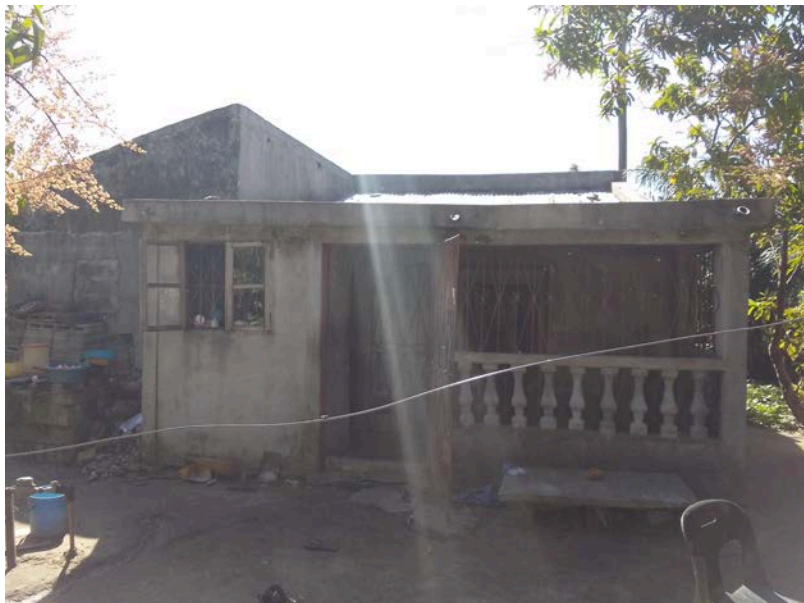
Habitação - Foto da esquina 2