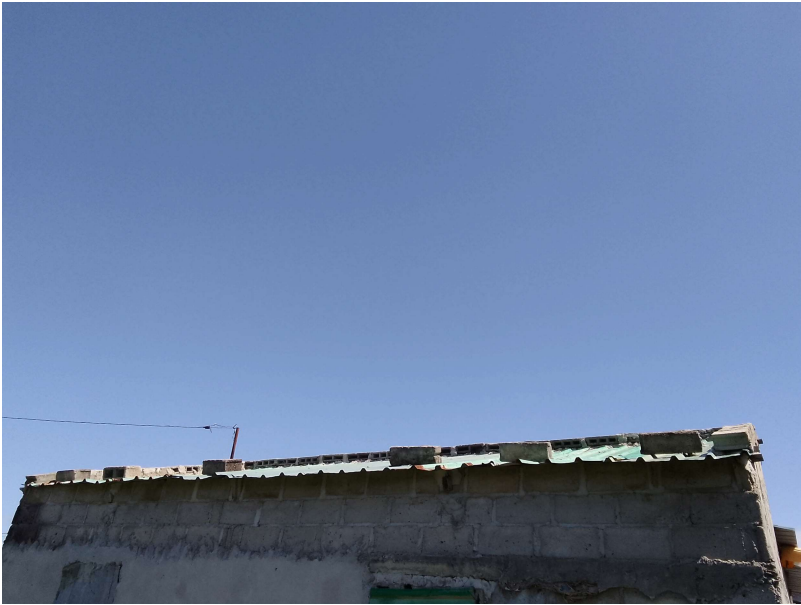
Foto da casa