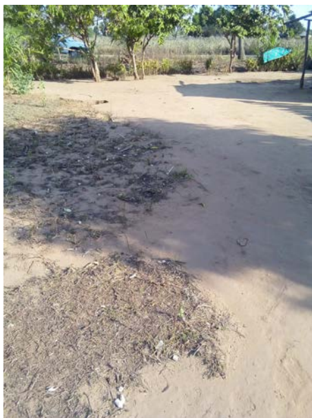
Foto do lugar onde o AF pode ficar temporariamente